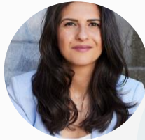
Serap Güler, MdB Vorstandsvorsitzende