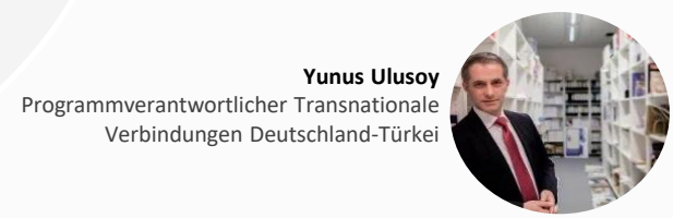
Yunus Ulusoy Programmverantwortlicher Transnationale Verbindungen Deutschland-Türkei