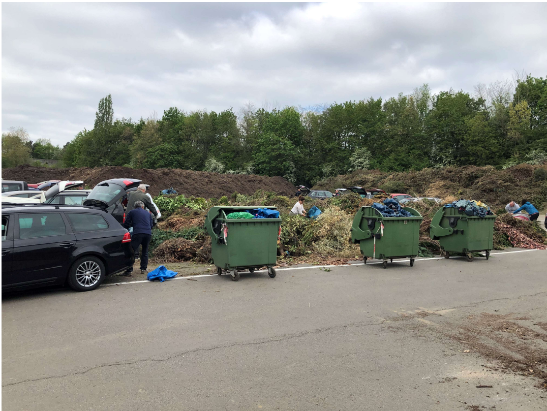
Abladestelle an der Kompostierungsanlage

Erfahrungsbericht 2023 und Termine für 2024