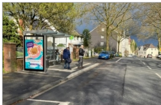
Abbildung 3: Haltestelle Am Remberg in Dortmund

Notwendig wird dies oftmals durch vorhandene Einfahrten, Baumbeete, Lichtsignalanlagen, Kurvenradien etc.. Zunächst wird geprüft, ob die Haltestelle in unmittelbarer Umgebung verlegt werden kann, um die Ausbaulänge von 20 m zu realisieren. Sollte dies nicht möglich sein, muss im Einzelfall von der angestrebten Ausbaulänge abgewichen werden. Es ist jedoch immer davon auszugehen, dass auch bei verkürzten Bussteigen die ersten beiden Türen barrierefrei zugänglich sind (s. Abbildung 4).