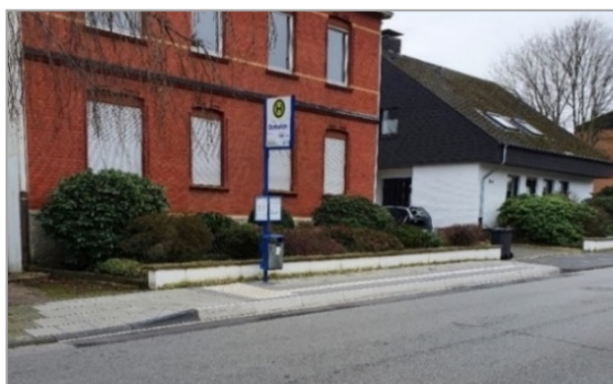
Abbildung 2: Haltestelle Osthofstr. in Hagen

Dennoch gibt es bereits umgebaute Haltesteige, die aufgrund der örtlichen Gegebenheiten eine deutlich kürzere Ausbaulänge aufweisen (z.B. Haltestelle Osthofstr., Länge ca. 12 m, s. Abbildung 2). Auch in anderen Städten werden an gut frequentierten Haltestellen, an denen Gelenkbusse halten, teilweise sehr kurze Ausbaulängen umgesetzt (z.B. Haltestelle Am Remberg in der Stadt Dortmund, Länge ca. 9 m, s. Abbildung 3). Dementsprechend zeigt sich auch in anderen Städten, dass Ausbaulängen von 20 m in der Praxis nicht immer umsetzbar sind.