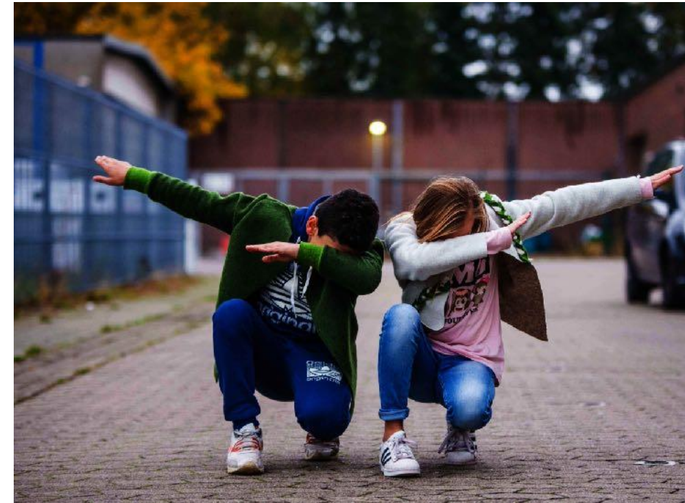
Kulturrucksack NRW Minden 2016