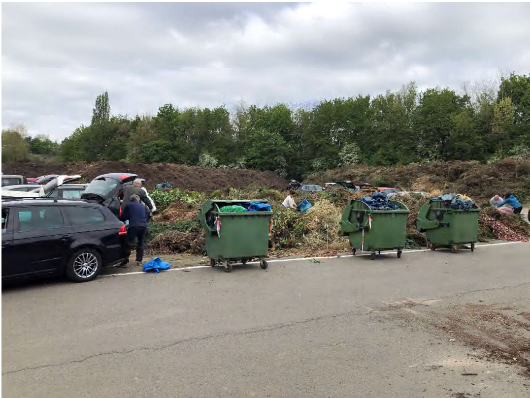
Abladestelle an der Kompostierungsanlage

Erfahrungsbericht 2021 und Termine für 2022