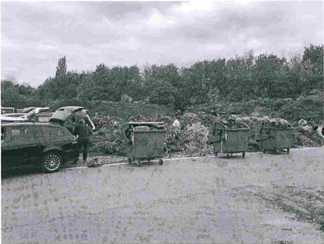
Abladestelle an der Kompostierungsanlage

Erfahrungsbericht 2020 und Termine für 2021