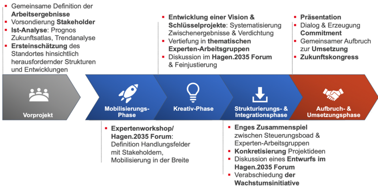
Abbildung 2: Zusammenfassende Übersicht vom Projektstart bis zur Umsetzung

Das geplante Vorgehen des Gesamtprozesses sieht wie folgt aus: