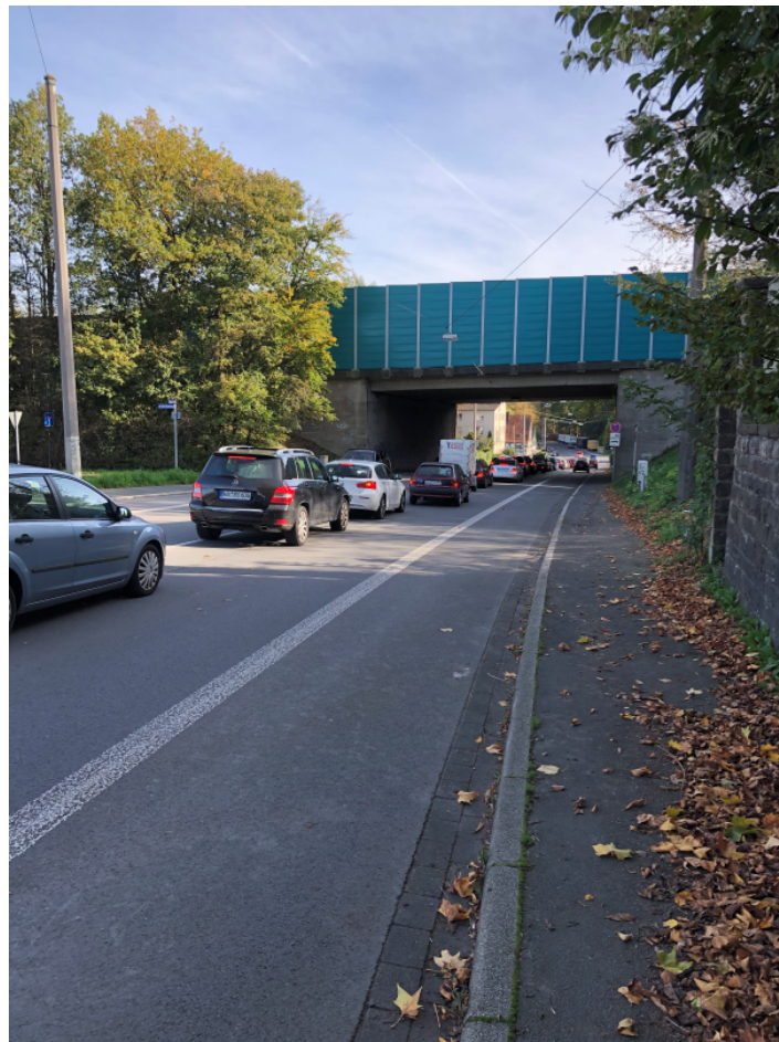
Abbiegespur zur Kompostierungsanlage am 26.10.19