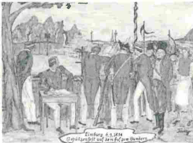
Limburger Schützenfest auf dem Hof zum Sundern 1834.

Seit der vom Gesetzgeber vorgeschriebenen Schießstätten - Regelüberprüfung am 24.5.19. durch den Schießstandsachverständigen Herr Faulstich aus Wuppertal, ist das traditionsreiche bis in die vorchristliche Zeit reichende, heimatliche Brauchtum der Hohenlimburger Schützenfeste , in Gefahr für immer aus dem Hohenlimburger Kulturbereich zu verschwinden. Herr Faulstich wartete hier am 24.5. mit den neusten Vorgaben des Gesetzgebers auf. Diesen Vorgaben konnte der KK Gewehr Schützen - Vogel-