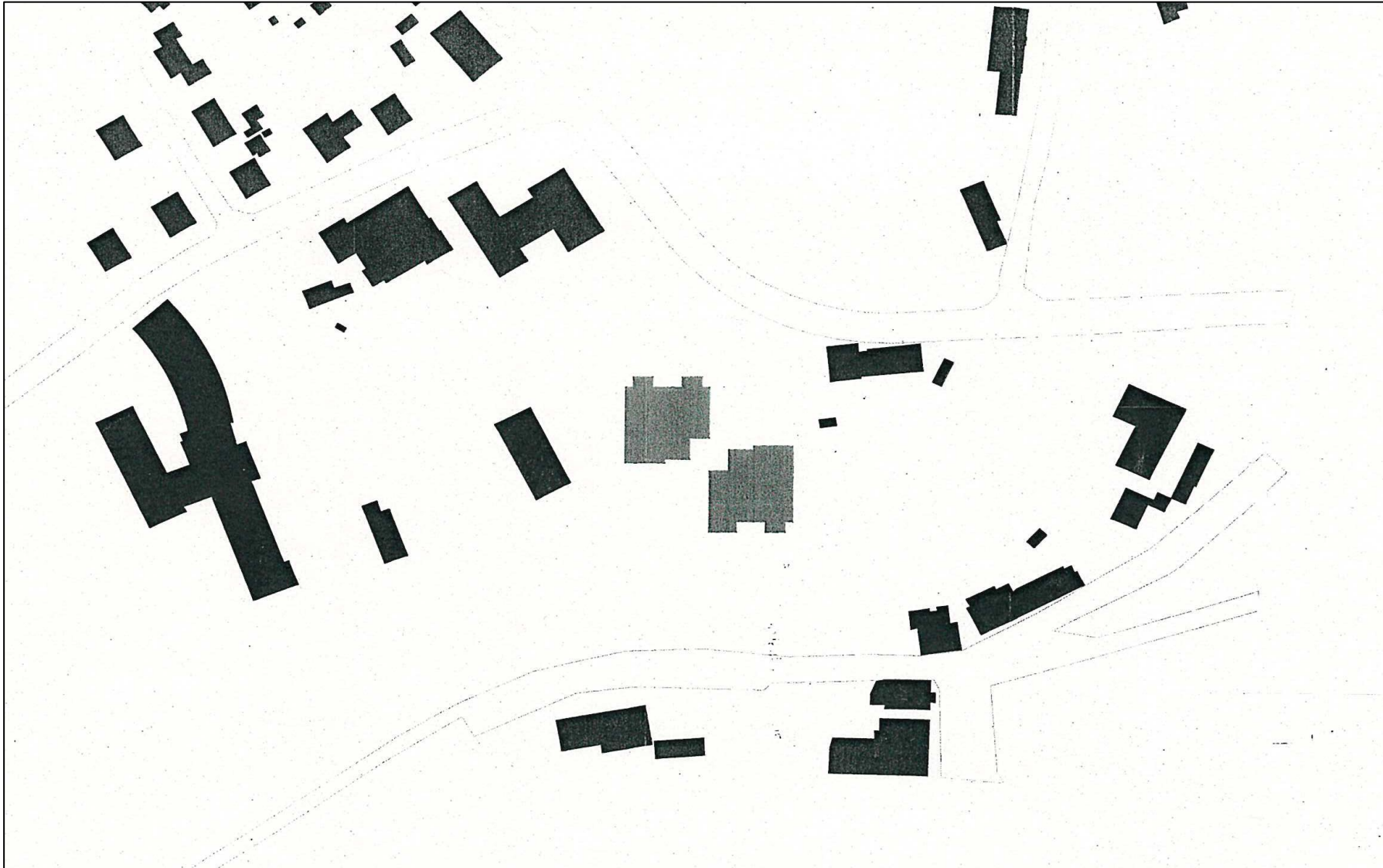
Schwarzplan (ohne Maßstab)

Neubau von zwei Wohnhäusern mit insgesamt 30 barrierefreien Wohneinheiten, einen Gemeinschaftsbereich und einer Stellplatzanlage für 14 PKW, Ribbertstr. 3 – 3a in Hagen-Dahl Drucksachen-Nr.: 0631/2018