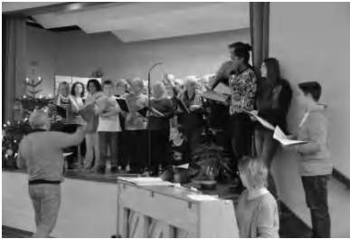
Bild The Mix Up und Projektchor in der Probe zum Musical

Jugendband der Evangelischen Kirchengemeinde Haspe