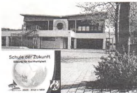
Grundschule Geweke Ennepeufer 5 58135 Hagen