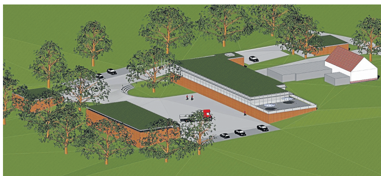
Der Wirtschaftsbetrieb Hagen möchte im Deerth den Forstbetriebshof für etwa 3,5 Millionen Euro erheblich erweitern. Neben Unterstellmöglichkeiten für Fahrzeuge (links) soll ein Gebäude mit Büro- und Schulungsräumen (Mitte) entstehen.

All diese Defizite könnten durch die Neubauten im Stadtwald auf einen Schlag beseitigt werden, während die Einrichtungen am Kurk – mal abgesehen vom Forsthaus – aufgegeben und abgerissen könnten, so die Überlegungen des WBH-Chefs. Mit einer Zufahrt von der Deerthstraße aus sollen auf dem Scheitelpunkt des Höhenzuges zwei Gebäude entstehen: Neben einer offenen, aber überdachten Lagerhalle für Kaminholz ist ein Funktionsgebäude mit Fahrzeughalle und Werkstatt gedacht, das zudem über ausreichende Sozialräume, Büros so-