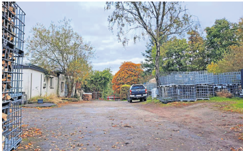
Zurzeit präsentiert sich die Situation am Deerth eher ungeordnet und improvisiert.