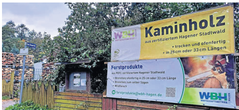
Das Kaminholz-Geschäft - hier Plakate zu sehen - hat nicht zuletzt aufgrund der Energiekosten-Explosion deutlich angezogen.

Gebäude addiert sich auf etwa 1300 Quadratmeter, wobei das Hauptgebäude und das Holzlager - bei Bedarf - durch zusätzliche Funktionsanforderungen sogar noch einmal mit überschaubarem Aufwand verlängert werden könnten. Die Beheizung soll durch Wärmepumpentechnik sichergestellt werden. Dafür soll im Dachbereich zugleich eine Photovoltaikanlage aufgestellt werden, die ihre Energie in die ohnehin zu ertüchtigende Stromversorgung des Komplexes einspießt.