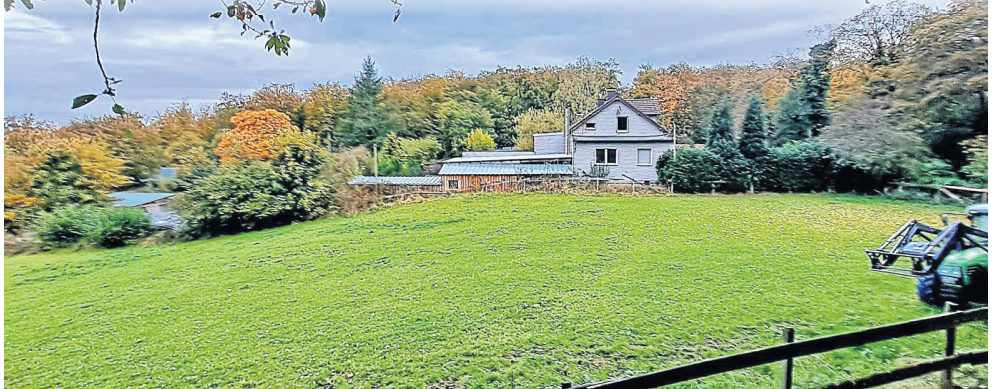
Am Deerth (Stadtwald, Wehringhausen) soll ein neuer Forstbetriebshof des WBH entstehen.

Vier Millionen Euro möchte der Wirtschaftsbetrieb Hagen (WBH) investieren, um den Mitarbeitern am Deerth moderne Rahmenbedingungen zu schaffen