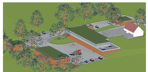
Eine erste Planskizze, die inzwischen noch einmal optimiert wurde, zeigt bereits, wie der neue Forstbetriebshof aussehen könnte.

der Forstbetriebszeiten am Deerth die Chance bieten, erlegtes Wild im Kühlraum zu deponieren. Die dazugehörige Wasch- und Umkleemöglichkeit soll dabei durch die Verlagerung eines Sozialcontainers vom Standort Kurk zum Deerth gewährleistet werden. Zugleich meldete der Verwaltungsrat zunächst Zweifel an, ob denn eine Fahrzeughalle dort tatsächlich notwendig wäre oder nicht auch ein Carport-Unterstand ausreichend wäre. Hier weist der WBH jedoch darauf hin, dass der Fuhrpark unter anderem mit Forstspeziialschlepper (Preis: 300.000 Euro), Rückeanhänger, 18-Tonnen-Lkw mit Ladekran, Ausbildungsbus und 3,5-Tonnen-Lkw mit Kipper so wertig sei, dass es angesichts der abseitigen Lage des Forstbetriebshofes geboten sei, hier der Sicherheit den Vorzug zu geben.