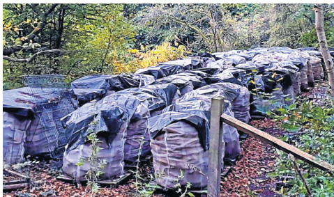
Zurzeit lagern die Brennholz-Vorräte im Hager Stadtwald abgedeckt unter Plastikfolien unter freiem Himmel.