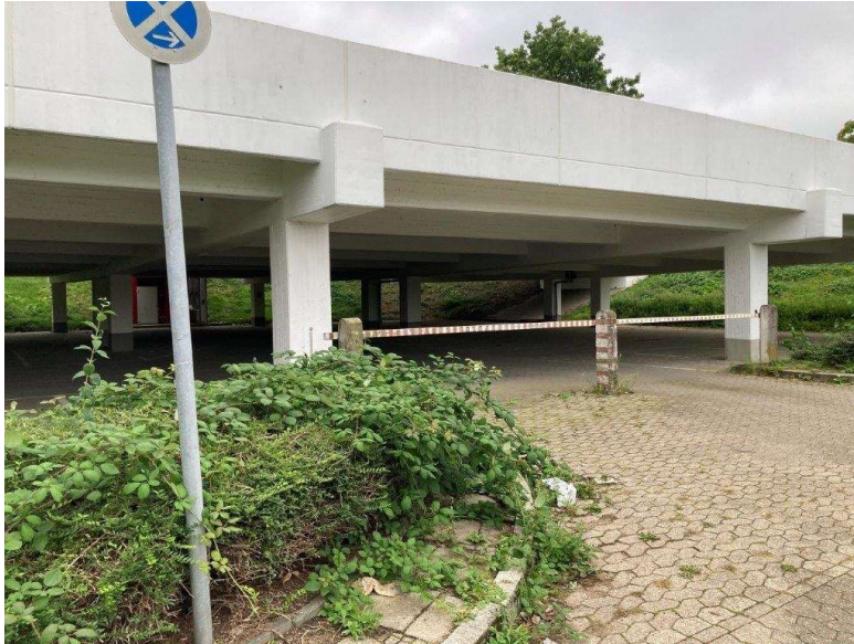
FSG Parkdeck unten