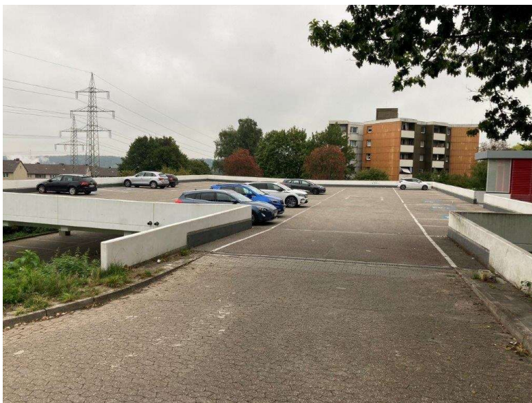
FSG Parkdeck oben